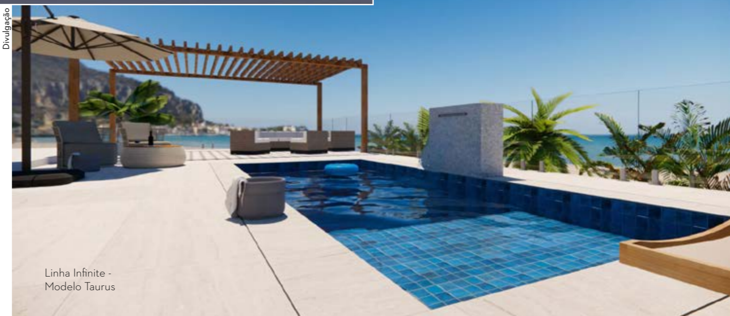
Linha Infinite - Modelo Taurus