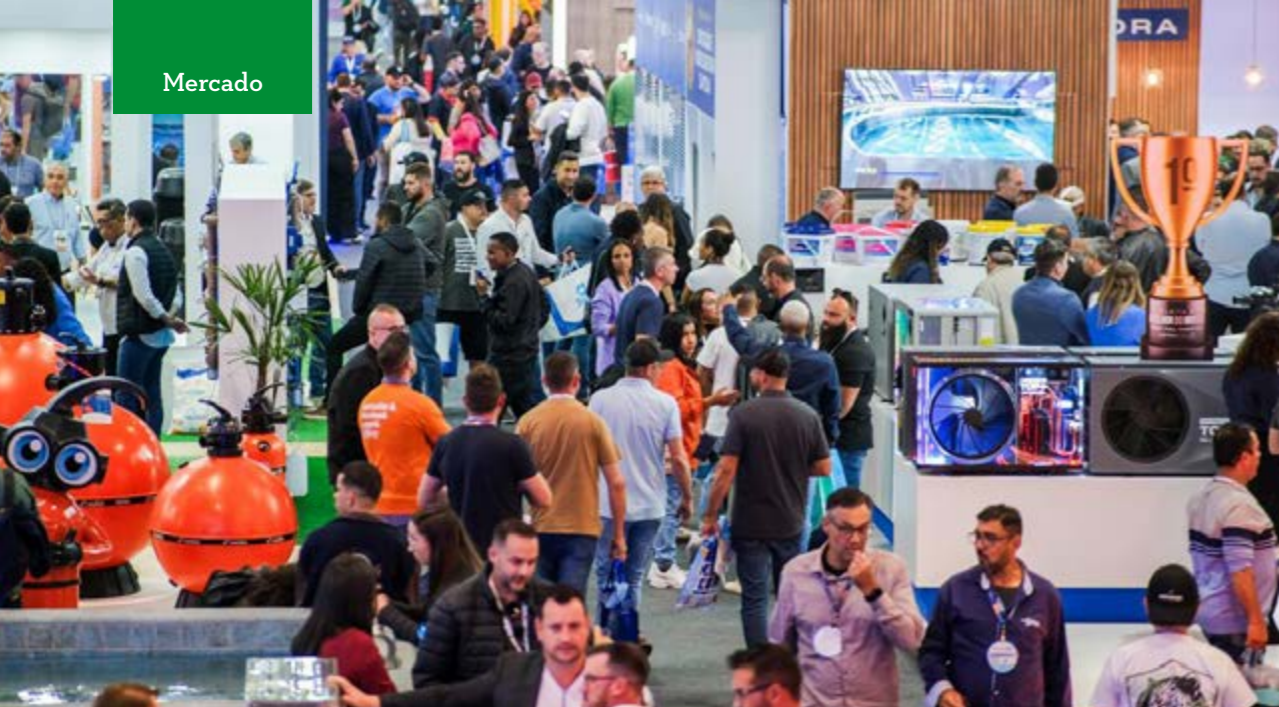
Entretenimento e bem-estar envolvem decisão do consumidor