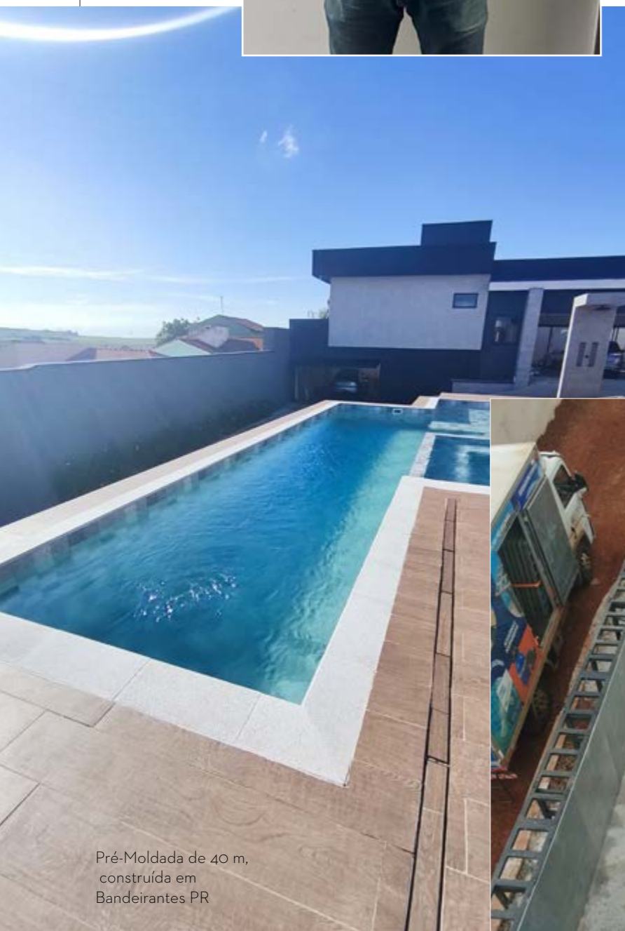
Pré-Moldada de 40 m, construída em Bandeirantes PR