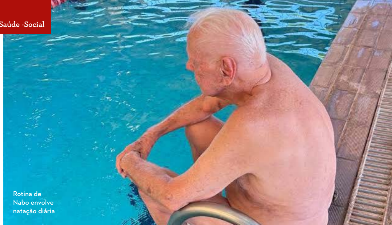
Rotina de Nabo envolve natação diária