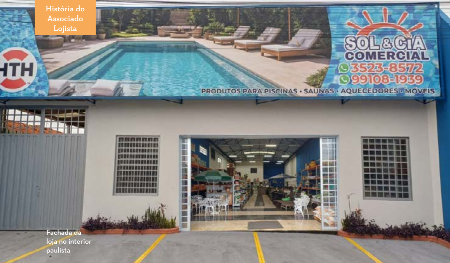
Fachada da loja no interior paulista