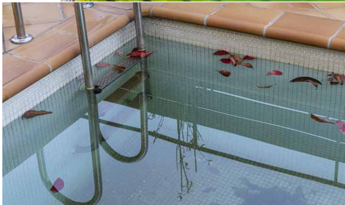
Além de ser um gasto desnecessário de água, ainda pode trazer prejuízos

D ia frio, muitas vezes, é sinônimo de piscina sem uso. E isso pode trazer o seguinte questionamento para você, ou seus clientes: será que vale a pena manter a piscina como está, ou devo esvaziá-la?